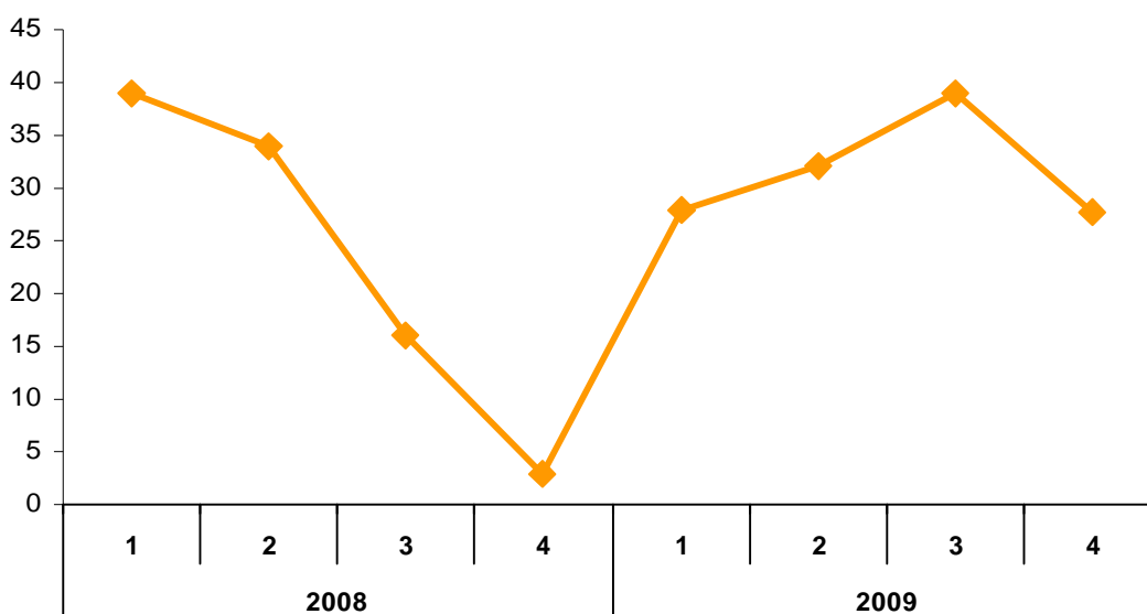
Framtidsbarometern mäter handlarnas framtidstro för det kommande året

Den minskade optimismen kan förklaras med att svensk konsumtion haft en stark utveckling trots lågkonjunkturen, framför allt under 2009 års andra halva. Samtidigt höjs det varnande röster för att konsumtionen är dopad med rekordlåga räntor och skattesänkningar. Det är ännu för tidigt att säga att lågkonjunkturen är över. När ett nytt år nu påbörjas är det naturligt att handlarna är lite avvaktande inför hur försäljningen kommer att utvecklas.